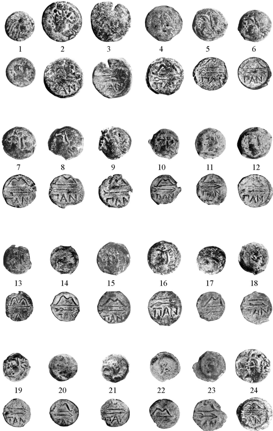
Figure 2 – Échantillon de monnaies de Panticapée du trésor d'Usatova Balka 2013